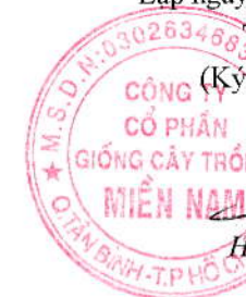
Hàng Phi Quang