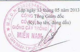
Hàng Phi Quang