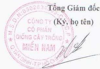
Hàng Phi Quang